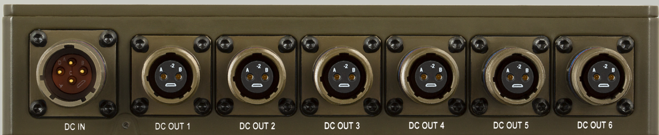
AT22102 ZADNÝ POHLAD